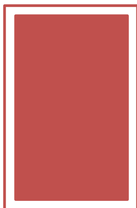
Ganze Seite: Format: 128 x 182 mm