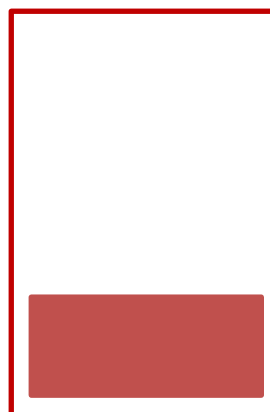
1/4 Seite: Format: 128 x 41 mm