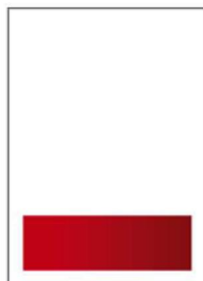
1/4 Seite Format: 126 x 41 mm