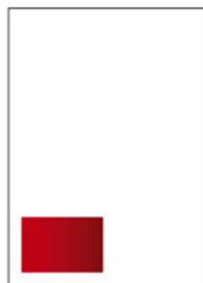
1/8 Seite Format: 60 x 41 mm